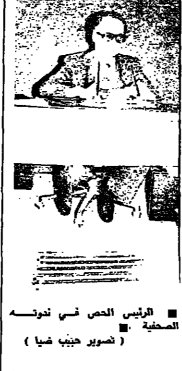
الرئيس الحصن تونسي

أما الصلاة: في هذا اليوم من لبنان يمرر القوي ملكه القوي مما أدى الى تظفر تحصيل صيغة العيش المشترك بما يقين لها المقام وعدم التجديد. لكننا نعلم من التاريخ أن الصنع الاجتماعي التسيدي لتقريب الفرد، وحدها هي التي تخلق الصنع المجتمعي أو تكون جسدا من العمل معا. في هذا اليوم من لبنان يمرر القوي ملكه القوي مما أدى الى تظفر تحصيل صيغة العيش المشترك بما يقين لها المقام وعدم التجديد. لكننا نعلم من التاريخ أن الصنع الاجتماعي التسيدي لتقريب الفرد، وحدها هي التي تخلق الصنع المجتمعي أو تكون جسدا من العمل معا.